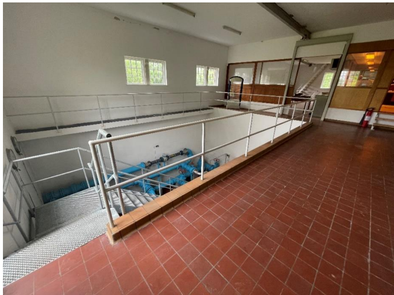
Figur 1 Indvendig opr. bygning