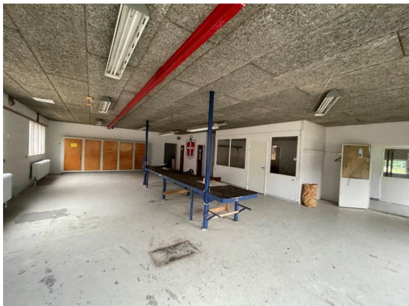
Figur 2 Indvendig senere tilbygning