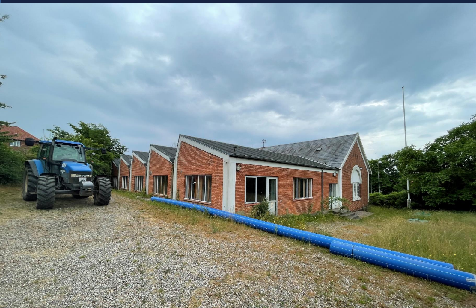
Grund - tidligere vandværk